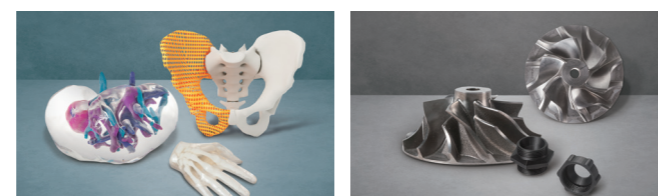
의료 보조기, 수술 가이드