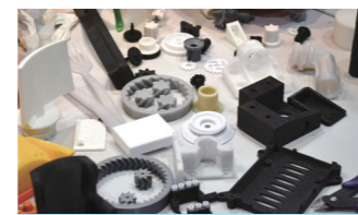
예술/문화재 전시, 복원